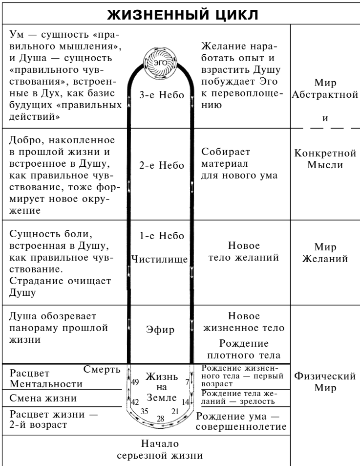
Диаграмма «ЖИЗНЕННЫЙ ЦИКЛ»

Диаграмма показывает путь Эго, которое представлено кружком сверху диаграммы, через чистилище и различные небеса, его возвращение к возрождению, а также семь периодов его земной жизни.